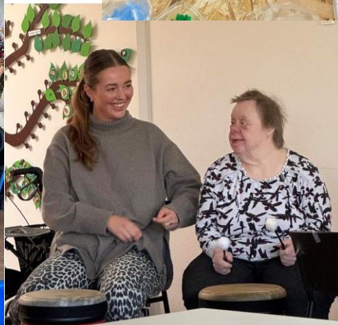
De studerende fra Friheden og Planeten havde lavet forårs koncert med nogle borgere som havde øvet i flere uger med "Der er i dag et vejr". Solen skinnede i dagens anledning 😊