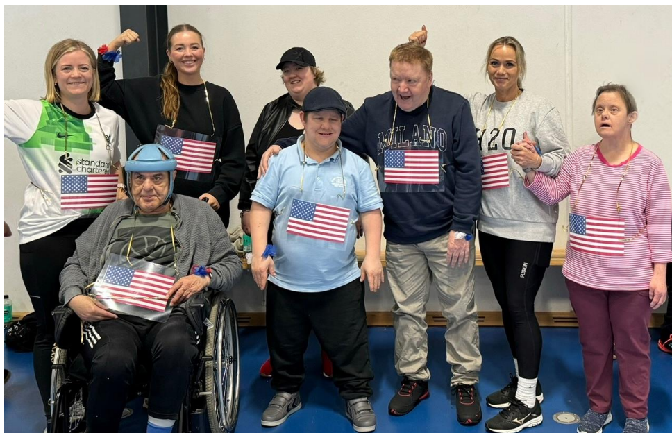
Friheden havde en sjov dag til aktivitetsdagen som Fys og Ergo studerende havde planlagt 😊